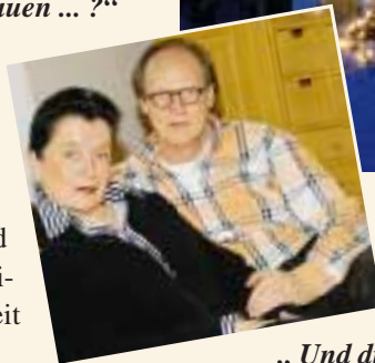
Haus Rudolph in Habach: Ein Diamant zeitgemäßen Wohnens